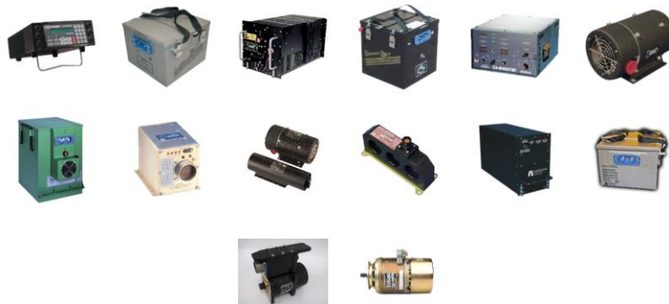
图 1：公司机电产品图

新飞机上以后，将在整个服役期中为公司带来净收益；同时，每个特定的系列平台可以 20~30 年，因此公司产品寿命可以高达 50 年。2017 年，公司 55%净收益来源于售后服务市场，售后服务市场提供的毛利率比原始设备制造更高，而且收益更加稳定。