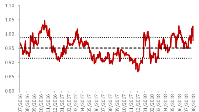
图 3: 预估市账率