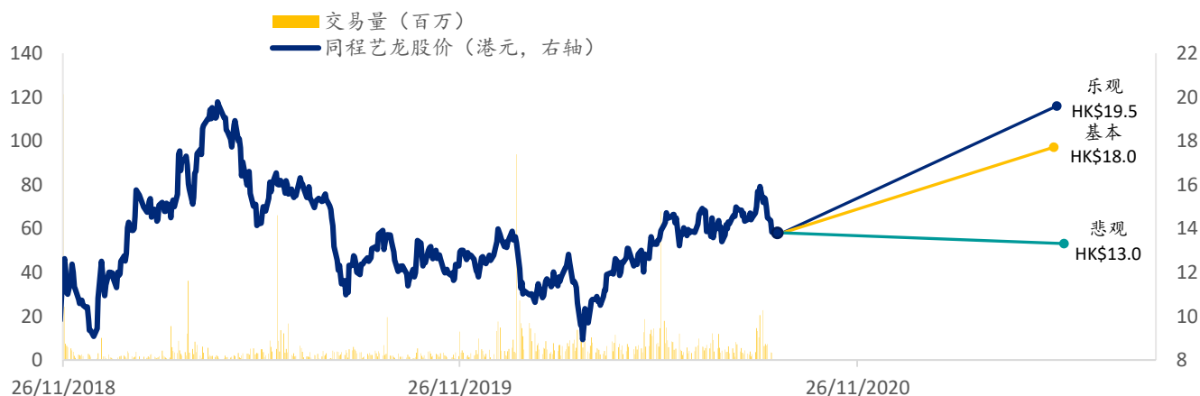
图表 7: 同程艺龙 SPDBI 情景假设