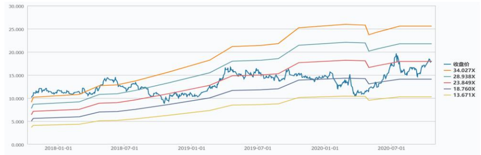
图1：公司过去三年平均市盈率（TTM）区间（股价：元/股）