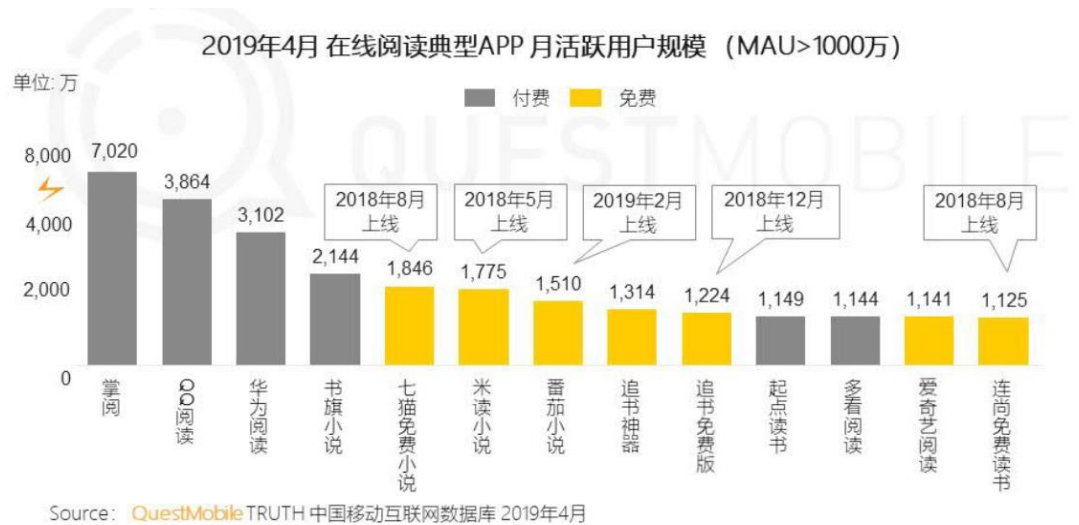
图 3：2019 年 4 月网易云阅读 MAU 小于 1,000 万

网易云阅读 App 用户体量不大： 根据 QuestMobile 在 2019 年 5 月发布《移动互联网在线阅读洞察报告》，MAU 超过 1,000 万用户的在线阅读 APP 共用 13 个，网易云阅读不在其列。据此推测，网易云阅读目前 MAU 应当小于 1,000 万。根据 Mob 研究院 2019 年 7 月发布的《2019 移动阅读行业洞察》，移动阅读端 APP 的 MAU 排行榜中，前 20 名榜单中也未出现网易云阅读。榜单第 20 名于 2019 年 7 月的月活为 400 万，推测网易云阅读的月活数据应当小于 400 万。由于网易云阅读用户体量较低，我们推测此次收购并不会为公司带来显著利润增量，更多从平台运营、内容资源、品牌影响力等角度增强公司阅读业务可持续竞争力。