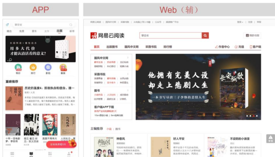
图 1：网易云阅读主要载体为 APP

网易云阅读成立于 2011 年 5 月，主打优质原创内容+畅销书籍。根据其官网介绍，其版权库有 20 万本正版书籍，截至 2016 年 12 月拥有超过 1 亿注册用户和超过 8,000 名知名网络文学作家。2017 年底，网易曾将包括网易漫画、网易文学、网易蜗牛读书与 LOFTER 在内的网易文漫事业部的业务打包并进行独立融资，但最终未能成功。2018 年 12 月 网易将网易漫画业务出售给哔哩哔哩。