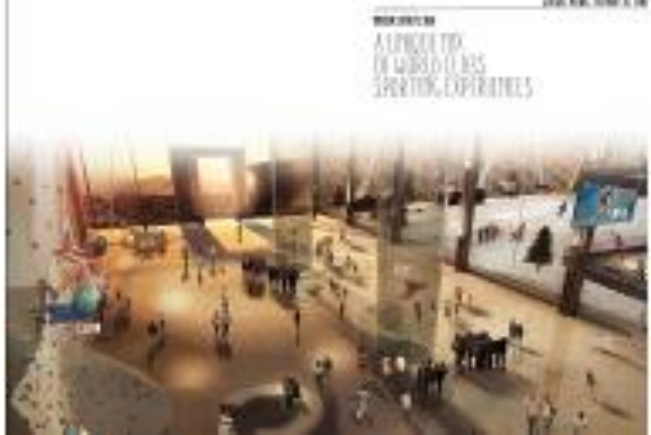
图 2：运动中心模拟图