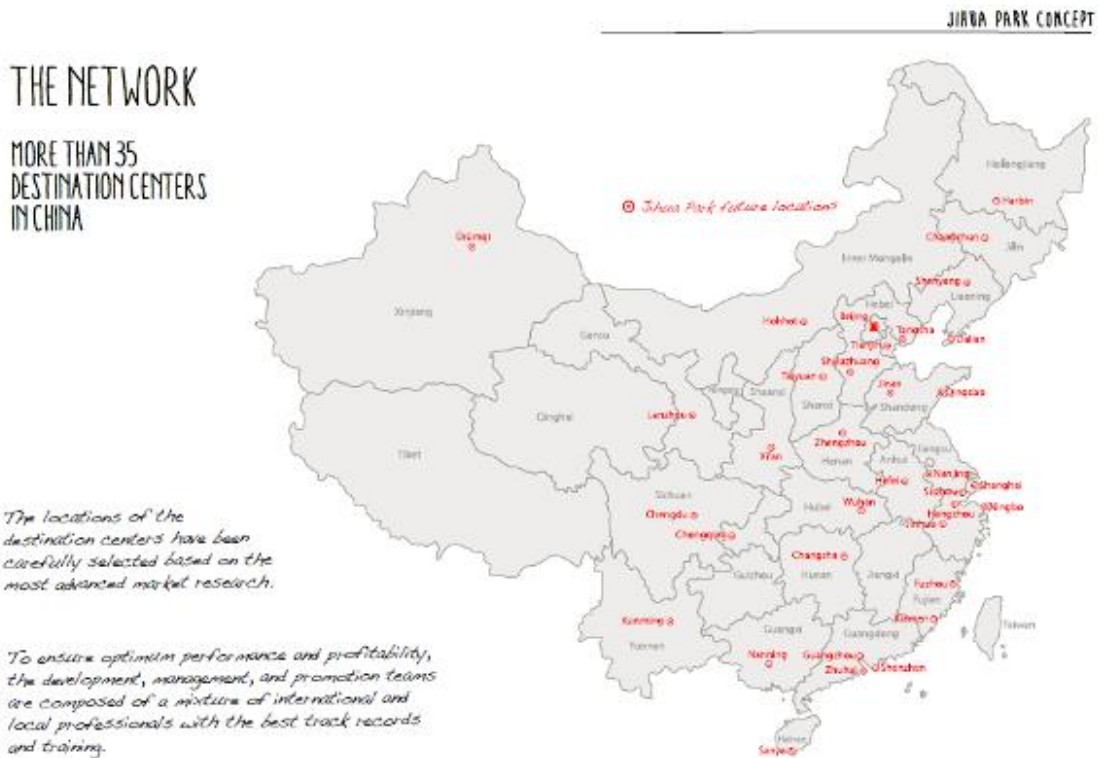
图 3：计划上 10 年内打造 35 个“际华目的地中心”项目