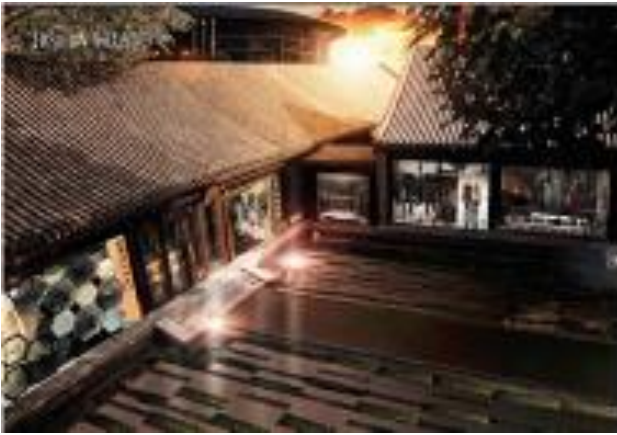
图 1：奥特莱斯模拟图