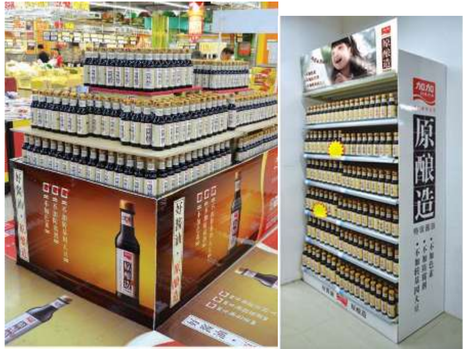
图：中高端新产品“原酿造”广西地区铺货情况