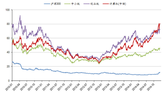
图 3：计算机板块历史市盈率