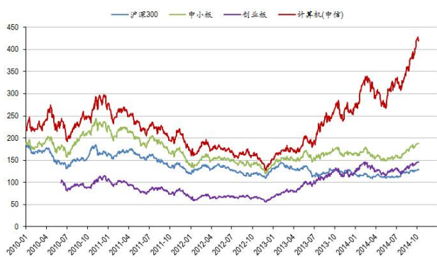
图 2：计算机板块历史走势