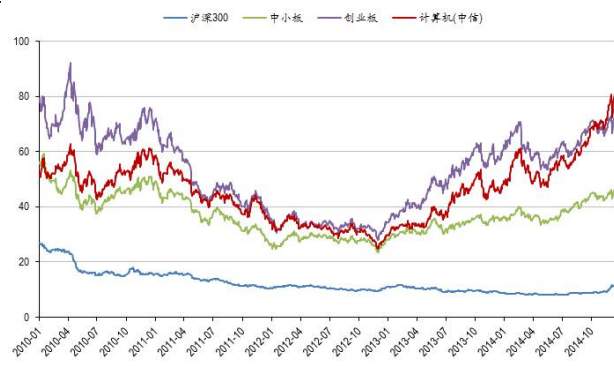
图 3：计算机板块历史市盈率