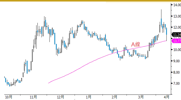
中國飛機租賃 參考數據