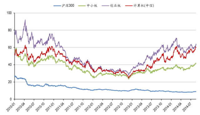
图3: 计算机板块历史市盈率