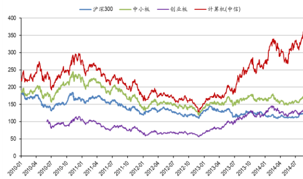
图2: 计算机板块历史走势